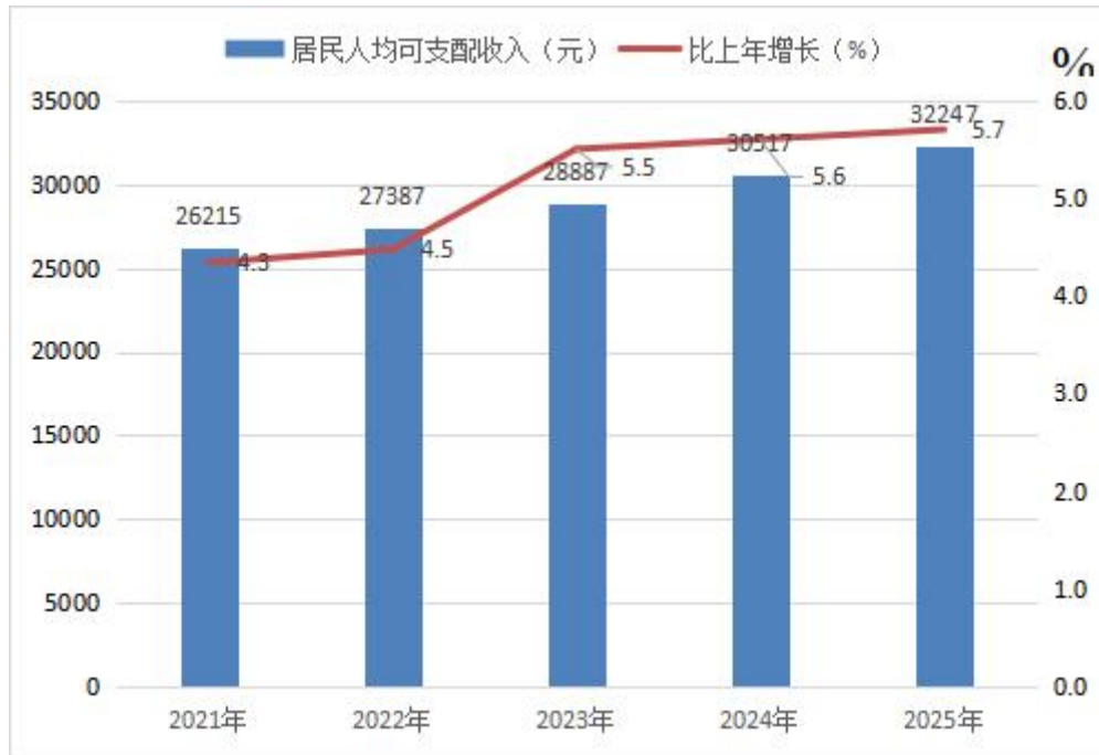
图 4 2021—2025 年全县居民人均可支配收入及增长速度

年末全县参加城乡居民养老保险人数 76653 人，比上年末下降 7.0%；参加职工企业养老保险 22021 人，增长 3.8%；参加职工医疗保险 41082 人，增长 2.0%；参加失业保险 22616 人，增长 2.7%；参加城乡居民基本医疗保险 156754 人，下降 1.7%；参加生育保险 24476 人，增长 1.3%；参加工伤保险 29138 人，增长 6.0%；